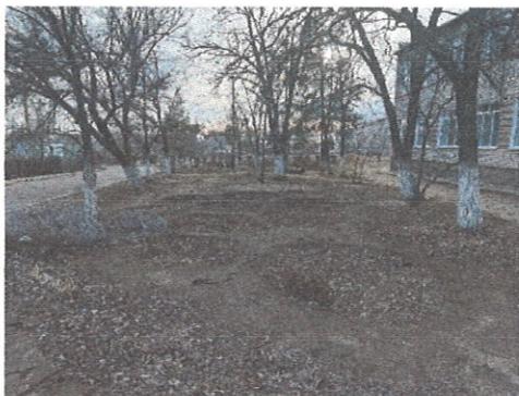
Рис.1 Фото «До»